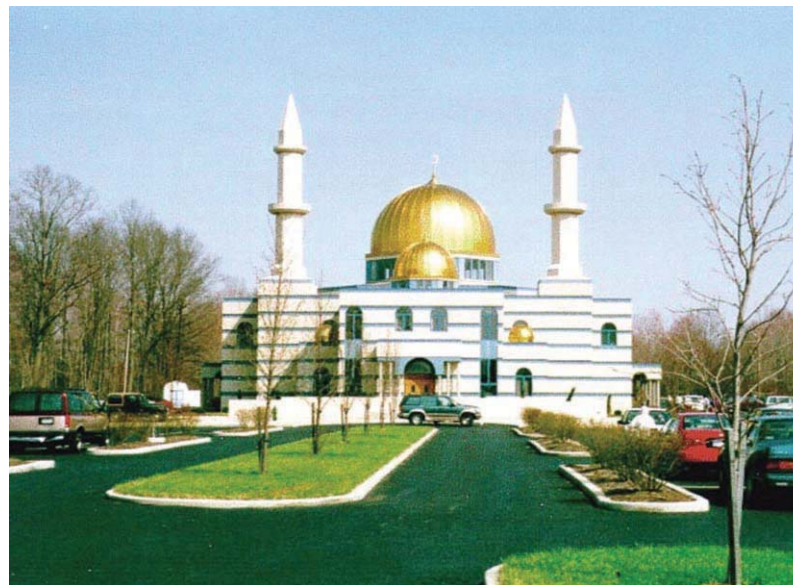
미국 오하이오주 클리브랜드 이슬람교 성원

At the rate that Islam is spreading, demographers